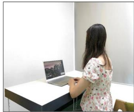
图3：侧后方第二机位效果图