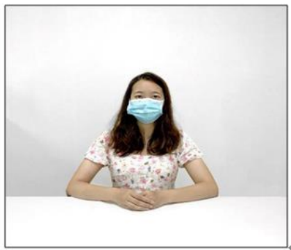
图2：正前方第一机位效果图